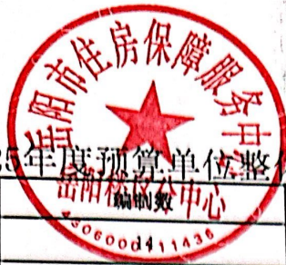
2025年度预算单位整体支出绩效评价基础数据表