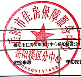
2025年度项目支出绩效自评表