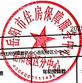
2025年度项目支出绩效自评表