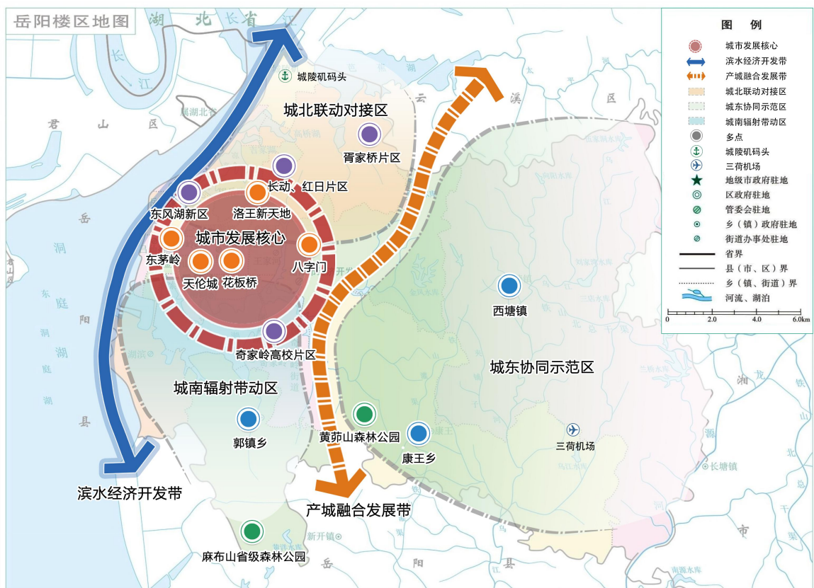
图 2 “一核、两带、三区、多点” 总体空间格局