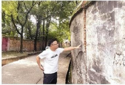
社区工作人员现场查看围墙情况

岳阳楼区千亩湖小学体育场有一堵围墙,墙面上出现了裂缝,且围墙已严重倾斜,存在极大的安全隐患。围墙外边紧邻的是一条背街小巷,为周边居民通行的必经之道,来往人流、车流较大,一旦围墙坍塌,后果不堪设想。希望有关部门尽快消除安全隐患。(余先生)